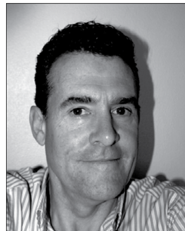
Nick Hopgood, le photographe

présentent toute la diversité et le chatoiement de notre faune et de notre flore aquatiques ; des espèces jusque-là inconnues. Chose